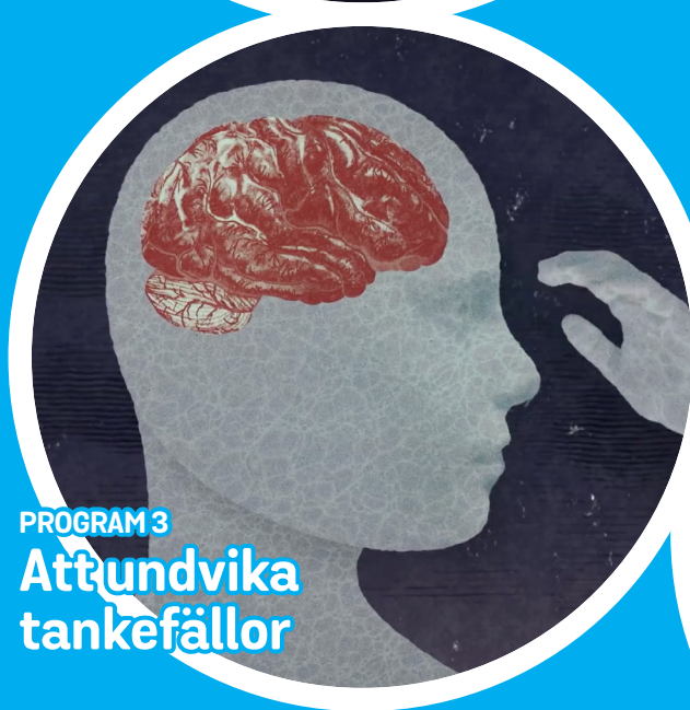
PROGRAM 3 Att undvika tankefällor