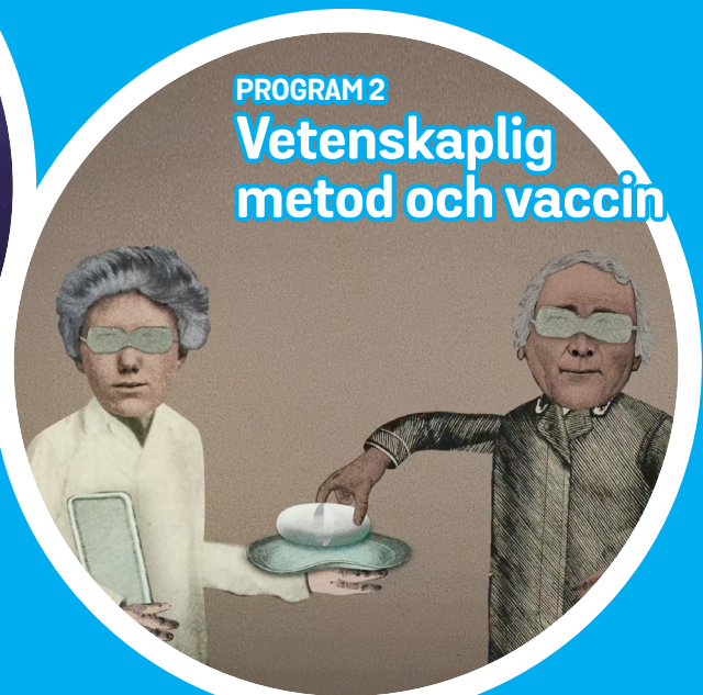
PROGRAM 2 Vetenskaplig metod och vaccin