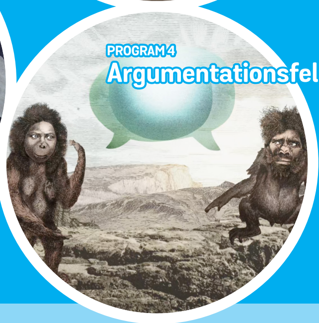
PROGRAM 4 Argumentationsfel

PROJEKTET "KLARTÄNKT" BESTÅR AV FYRA VIDEOFILMER OCH DENNA LÄRARHANDLEDNING.