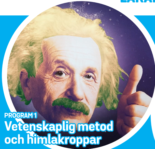
PROGRAM 1 Vetenskaplig metod och himlakroppar

LÄRARHANDLEDNING Siv Engelmark Åsa Sundelin